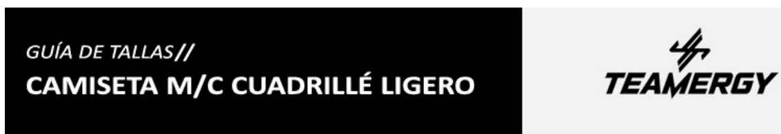
TABLA DE MEDIDAS PRENDA TERMINADA EN CM (± 2 CM)

En el momento de realizar la inscripción se seleccionará la talla correspondiente a la camiseta técnica que se entregará con el dorsal, no pudiendo realizar cambios posteriores.